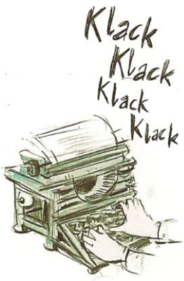
SE-RES BRIEF-WECH-SELS ... AM FÜNF-ZEHN-TEN MAI DES JAH-RES ...