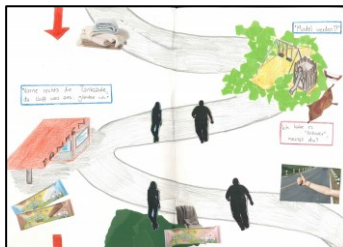
Abb. 3: Schülerarbeit: Plakat