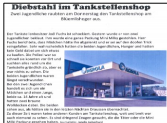
Abb. 4: Schülerarbeit: Zeitungsbericht (3.3)